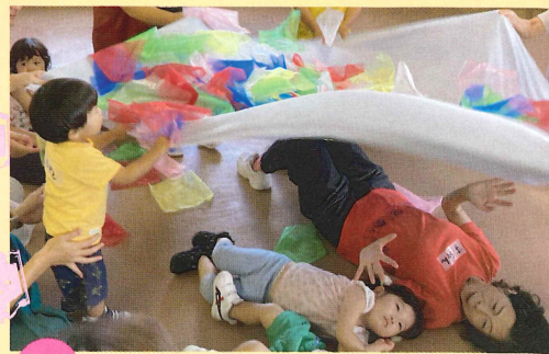
参加者のみなさんの声

アフタフ・バーバンの魔法と みんなのわくわくの想像力で 絵本の世界に出発しよう！ どんなたのしい探検になるかな？ 毎回大人気の表現ワークショップです！