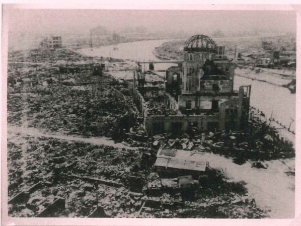
原爆ドーム