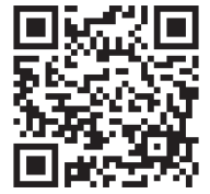
講座受付フォーム