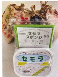
●サングリーン 環境とお肌に優しい、 米ぬか100%の 台所用石けんです。