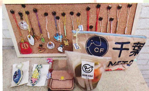
●あさやけ第二作業所 小平産の季節の野菜を使用した ピクルスと雑貨を販売します。