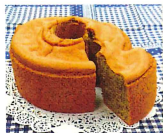
●あさやけ作業所 使いやすい和ふきんと手作りのお菓子 おいしいよ！

あさやけ作業所 あさやけ第二作業所 あさやけ鷹の台作業所 サングリーン あさやけ風の作業所 あさやけ喜平橋食堂