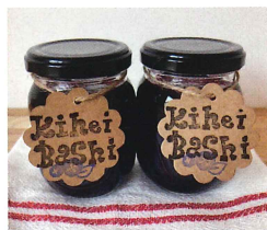
●あさやけ喜平橋食堂 小平産ブルーベリージャム。