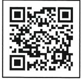
講座受付フォーム