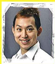
演出・構成担当 ポケ

観客参加コーナーでは大盛り上がり間違いなし! ご家族揃って楽しめるタップドゥ!! これはまさにエキサイティングなショータイム!!