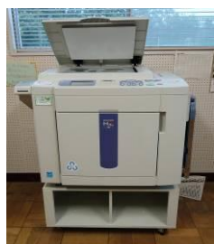
リソグラフ簡易印刷機

○印刷機は、単色印刷の他に、黒・赤・青・緑の4色のうち2色を使う2色印刷もできます。また、パソコンとつないでUSB内のデータを印刷すると鮮明に印刷ができます。さらに、印刷の前にあすぴあ内の貸し出しパソコンで微修正もできます。(登録団体)