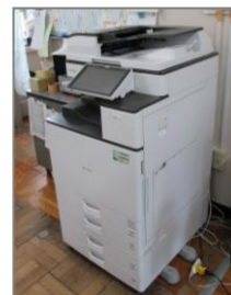
カラーコピーは実費精算

○交流スペースは団体登録していない方々も利用できます。大きなテーブルで展示物を作る際には備え付けの文房具を使うことができます。印刷作業後の仕分け丁作業にも便利です。