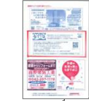
市役所窓口封筒に 広告を掲載