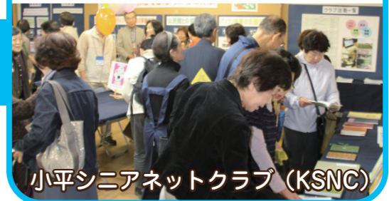
小平シニアネットクラブ (KSNC)