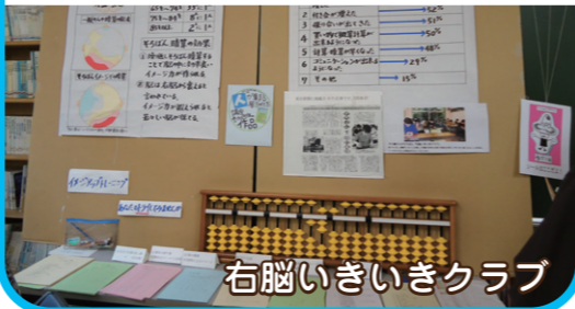
右脳いきいきクラブ