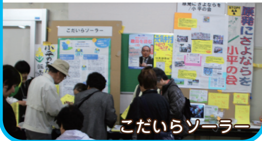
こだいらソーラー