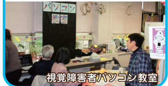
視覚障害者パソコン教室