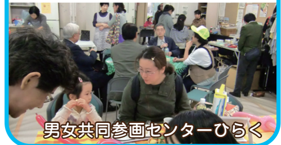
男女共同参画センターひらく